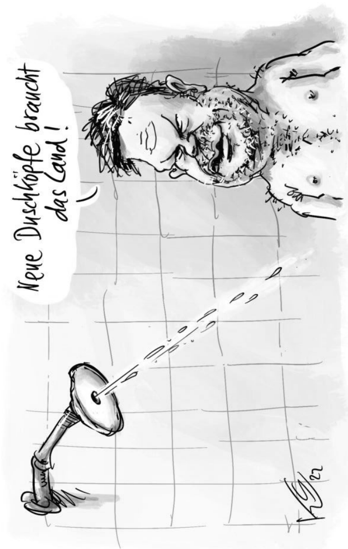
Karikatur: Klaus Stuttmann